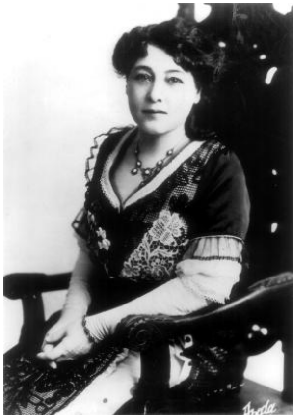
Alice Guy, Apeda Studio New York, 1913. Source : Collection Solax, Wikimedia Commons

Le cinéma européen s'est construit face à Hollywood comme un « cinéma d'art » où s'illustrent depuis les années 1910 des « génies » dont les films célèbrent des actrices qui seraient leur « création ». Pourtant, le cinéma européen est aussi un cinéma populaire qui s'illustre par des genres et des stars d'une plus grande mixité. Les rares réalisatrices sont les grandes oubliées de l'historiographie ; plus nombreuses depuis les années 1980, elles restent limitées par un plafond de verre, que l'Union européenne tente de soulever avec plus ou moins de succès.