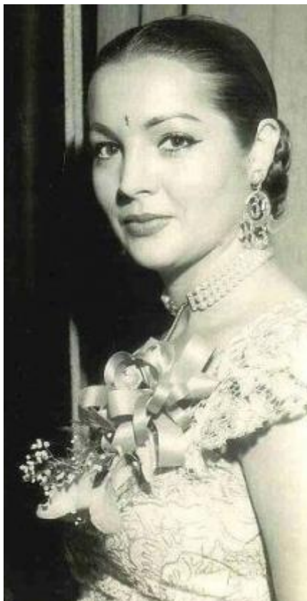
Sara Montiel, 1955.