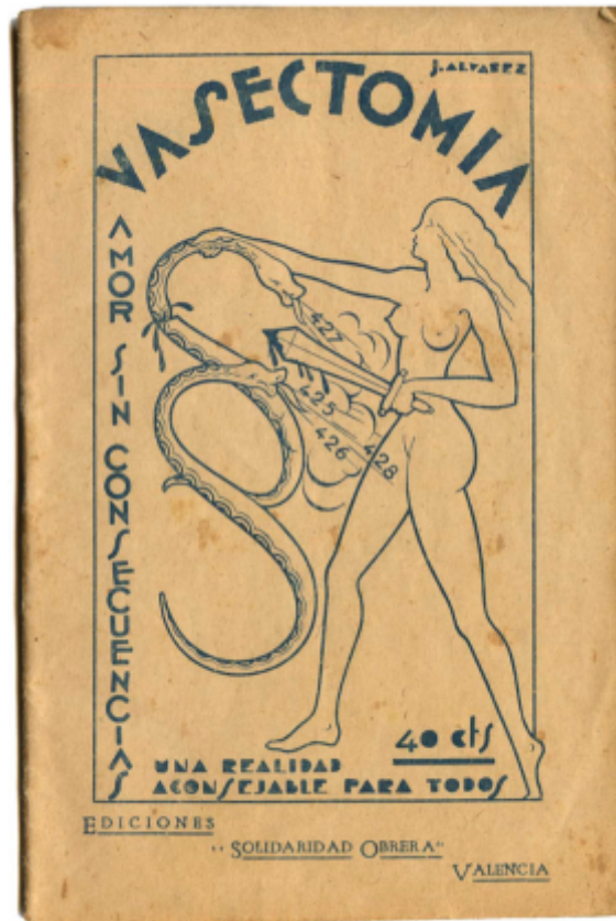
Brochure en faveur de la stérilisation masculine : Vasectomie. Amour sans conséquences. Une réalité à conseiller à tous, Valence, Solidaridad obrera, 1933.

Après deux siècles de triomphe des castrats sur les scènes lyriques, l'Europe voit disparaître à partir de 1830 une pratique devenue incompatible avec l'impératif social et politique de dichotomie des sexes qui marque le XIX e siècle. La castration devenue honteuse est source d'une angoisse profonde pour les hommes qui doivent néanmoins s'y résoudre pour des raisons médicales (lèpre, tuberculose ou goutte). Les chirurgiens, qui considèrent les risques psychiques de la disparition des testicules plus graves que les effets physiologiques de l'opération, font parfois - c'est le cas en France - usage de postiches pour préserver le sentiment de virilité des patients.