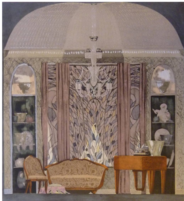
Maurice Dufrené, Petit salon, pavillon Une Ambassade française de la Société des Artistes décorateurs, Exposition internationale des arts décoratifs et industriels modernes, Paris, 1925.

L'Exposition internationale des arts décoratifs et industriels modernes, qui se tient à Paris en 1925 et réunit la production de pas moins d'une vingtaine de nations, majoritairement européennes, a notamment pour but de démontrer l'excellence du savoir-faire français. Bien des pavillons érigés en cette occasion font ainsi part d'une débauche de luxe, pour des réalisations se voulant modernes tout en montrant une inspiration puisée dans les grands styles français du passé. La manifestation ne peut cependant être réduite à ce faste et aux tendances dites traditionalistes de l'art déco, ce qu'attestent en particulier les réalisations présentées par des créateurs aux conceptions plus modernistes. Par ailleurs, les participations étrangères à l'Exposition sont souvent marquées par une inspiration locale mettant en exergue les sentiments identitaires qui ne cessent de s'affirmer en Europe.