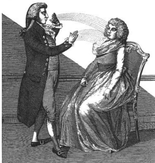
« Animal magnetism : The operator putting his patient into a crisis », dans Ebenezer Sibly, A Key To Physic and the Occult Sciences, 1814.

À partir de la seconde moitié du XVIII e siècle, l'association classique entre femmes et superstitions connaît un renouvellement. Leurs visions, leurs pouvoirs de guérison ou de nécromancie sont tout d'abord réévalués et réinterprétés, mais à l'aune de nouveaux savoirs médicaux ou spirituels dominés par les hommes entre la fin du XVIII e siècle et le début du siècle suivant, dans les grandes villes européennes. Les croyances ancestrales et les rites populaires, y compris lorsqu'ils sont pratiqués par les femmes, sont collectés à titre de trésors nationaux ou régionaux tandis que les sorcières sont réintégrées dans l'histoire nationale et le génie des peuples. Mais cette réévaluation est toujours fragile et est contrebalancée par un très fort scepticisme qui parfois l'emporte, comme à la fin du XIX e siècle, ou parfois cède devant d'autres intérêts plus politiques, comme dans les années 1930. Dès lors, à mesure que progresse l'idée que les superstitions ne sont plus que des survivances, la question du genre devient moins importante.