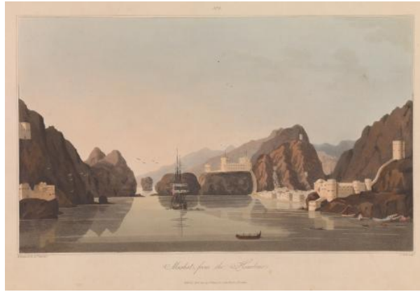
Mascate vers 1809, par Richard Temple (1813). National Maritime Museum, Greenwich London.