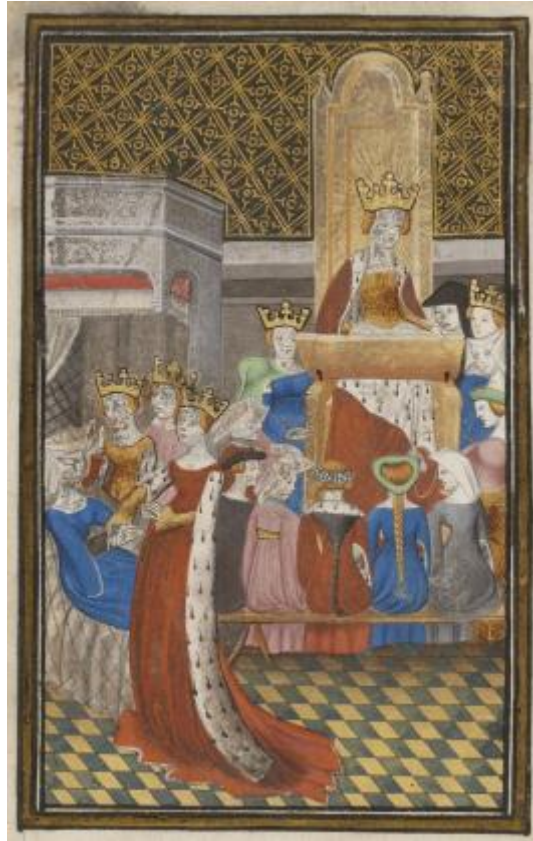
Christine de Pizan et les reines de la Cité enseignent aux Dames. BnF, fr. 25294, f° 6v.

Pegme, Lyon, Barthelemy Molin, 1560. Dans le livre d'emblèmes - ouvrages faisant se suivre des ensembles formés d'une maxime et d'un poème illustrés par un dessin - de Pierre Cousteau (mort en 1567), plusieurs chapitres portent sur le thème de la condition des femmes et délivrent des messages hostiles aux femmes en position de pouvoir. Ils sont illustrés par une image montrant la mère de l'empereur romain Héliogabale, Simiamire, qu'il avait autorisée à siéger au Sénat, assise sur un trône et discutant avec d'autres femmes.