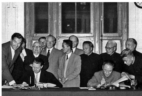
Signature de l'accord entre l'Ost- Ausschuss der Deutschen Wirtschaft et la république populaire de Chine à Pékin (10 septembre 1957).

Définies comme l'adhésion à des normes – juridiques, politiques, culturelles et professionnelles – communes à l'ensemble de la sphère diplomatique, reconnues par la tradition, et codifiées tardivement en 1815 et surtout 1961, les pratiques diplomatiques européennes se sont forgées dans la confrontation avec l'altérité représentée à l'époque moderne par les pratiques ottomanes, et éprouvée aussi lors de contacts avec les sociétés locales dans un contexte d'évangélisation et/ou de confrontation coloniale dans les Amériques, en Afrique ou en Extrême-Orient. Elles sont aussi marquées par deux processus, l'un en gestation, l'autre nouveau : la constitution d'un espace public où s'intensifient les débats sur les questions internationales et l'intégration d'une partie du continent portée par les dynamiques économiques mais fondamentalement soudée par un projet politique. Nous examinerons par conséquent comment ces pratiques ont évolué en fonction d'un triple défi : défi des mondialisations, défi de la démocratisation, défi de l'intégration. Nous mettrons ainsi en perspective la question d'une « mondialisation » des pratiques diplomatiques en ce début de xxi^e siècle.