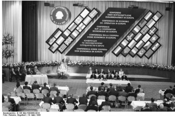
La conférence spéciale de l'OSCE sur la coopération économique en Europe (Bonn, mars-avril 1990).