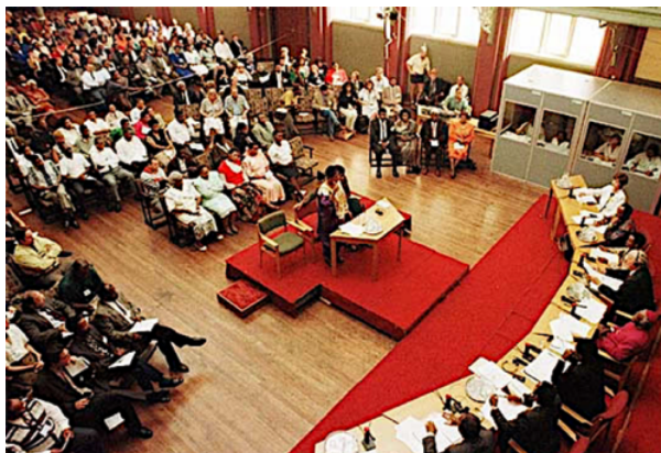
III.2. Un témoin devant la commission